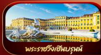
พระราชวังเซินบรูน์