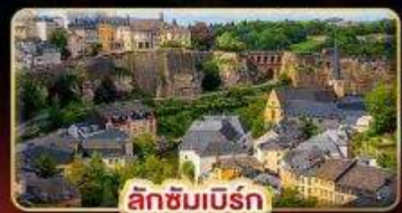
ลักซิมเบิร์ก

ที่สุดของธรรมชาติ แห่ง “ยุโรป” สวนดอกไม้ KEUKENHOF 1ปีมีครั้งเดียว