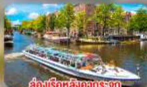
สองเรือหลังคากระจก