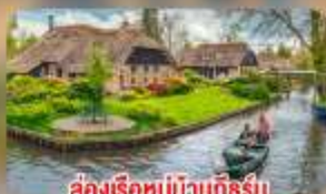
สองเรือหมู่บ้านทึร์น