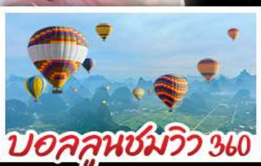
บอลลูนชมวิว 360