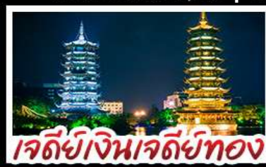
เจดีย์เงินเจดีย์ทอง

ล่องแพไม้ไผ่ แม่น้ำหลี่เจียง - ภูเขาห้วย กระเช้า ไปกลับ บ้านบันไดหลงเซ็น - เจดีย์เงินเจดีย์ทองวิวคำ เขางวงช้าง - บอลลูนชมวิว 360 ambu พิเศษ บูฟฟิตบึงย่างบาร์บีคิว ปลายอบเบียร์ เผือกคริสตล สุกี้เห็ด