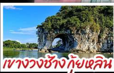
เขางวงช้าง กัซเซลิน