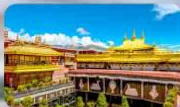
วัดโจกิง