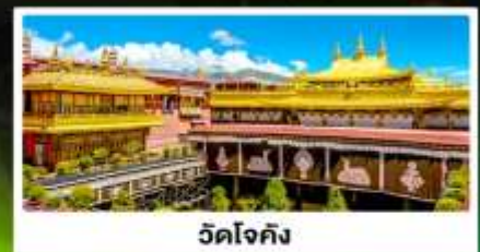
วัดโจคัง