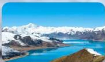
ทะเลสาบยิมครก