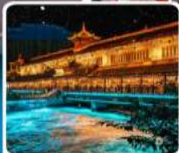
Blue Tears สะพานหนานเฉียว