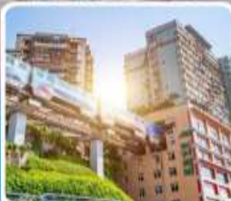
รถไฟฟ้าทะลุติ๊ก