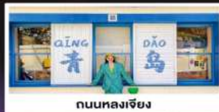
ถนนหลงเจียง