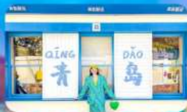
ถนนหลงเจียง