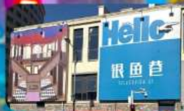
ตรอกซิลเวอร์ฟิช