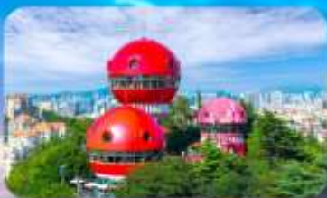
จุดชมวิว SIGNAL HILL