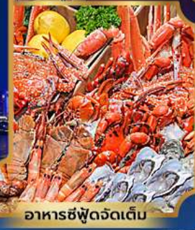
อาหารซีฟู้ดจัดเต็ม

บุฟเฟ่ต์เบียร์ไม่อื่น + ซีฟู้ด + ปิ้งย่างเกาหลี