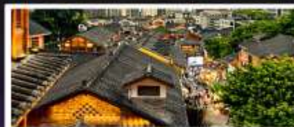
เมืองโบราณสือปาตี