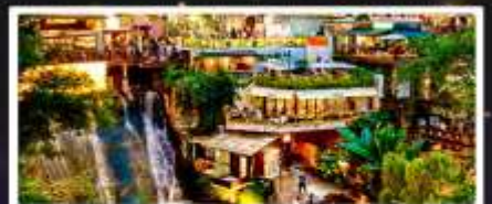
ถนนโบราณหลงเหมินฮ่าว