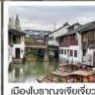
เมืองโบราณจูเจียเจี๋ย