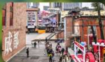
ดงเจียวจ้ออ๋