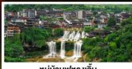
หมู่บ้านฟุทงเจิน