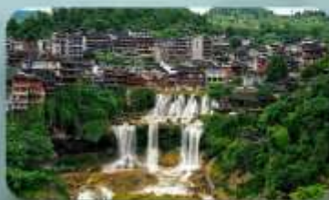
หมู่บ้านฟุทงเจิ้น