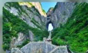
หุบเขาประตูสวรรค์