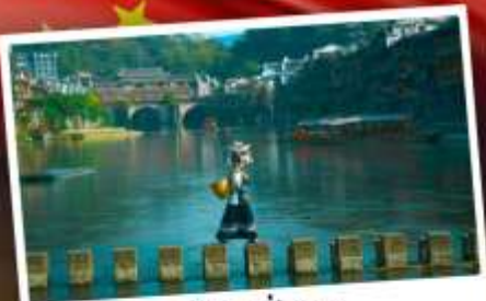
หมู่บ้านเฟิ่งทง

สุดคุ้ม!! พัก 5 ดาว ทุกคืน มนตร์เสน่ห์เมืองเก่า ริมสาងน้ำแจ่มใสแดน