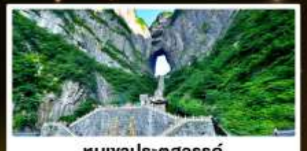
หุบเขาประตูสวรรค์