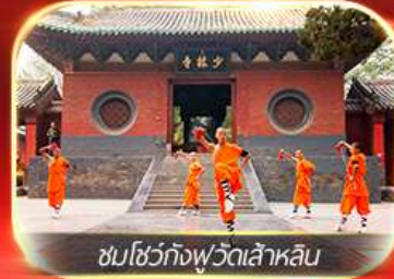
ชมโชว์ทงฟัวตเล้าหลิน