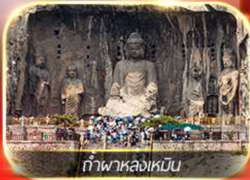
ถ้ำพาลงเหมิน