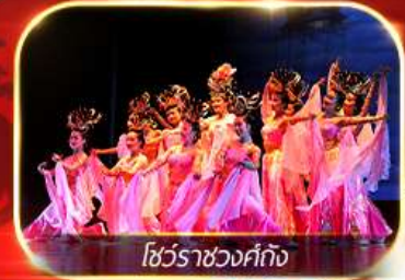
โชว์ราชวงศ์ทัง

สัมผัสความยิ่งใหญ่อลังการกองทัพจีนสี่ฮ่องเต้ นั่งรถไฟความเร็วสูงทะลุเมืองโบราณ ย้อนตำนานประวัติศาสตร์จีน