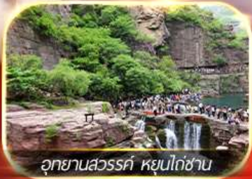
อุทยานสวรรค์ หุบไม้ชาน