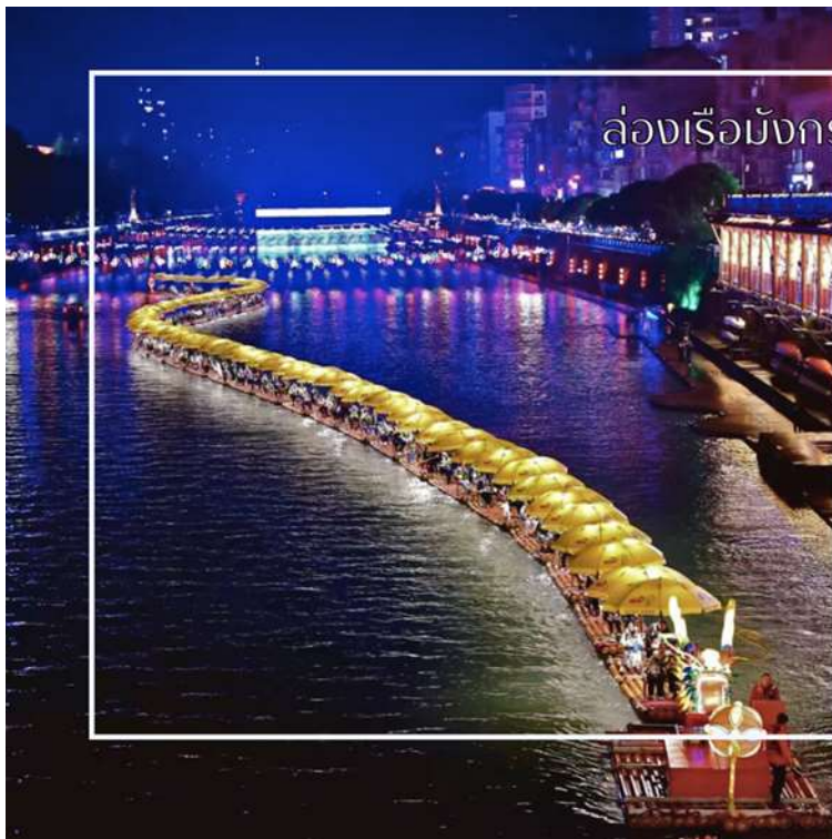
ล่องเรือมังกรแม่น้ำก้งสู่ย

นำท่านสัมผัสประสบการณ์สุดพิเศษ ล่องเรือมังกรแม่น้ำก้งสู่ย ชมวิวยามค่ำคืน เป็นหนึ่งในแม่น้ำที่มีความงดงามและสำคัญ มีชื่อเสียงจากทิวทัศน์ธรรมชาติที่อุดมสมบูรณ์ ริมฝั่งเต็มไปด้วยป่าไผ่ ป่าเขา และภูเขาหินทรายสลับซับซ้อน สายน้ำใสไหลเย็นตัดผ่านหุบเขา สร้างทิวทัศน์ที่งดงามดุจภาพวาด