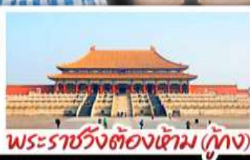
พระราชวังต้องห้าม (ทุ่งก)

2UPEK-CA004 | 6 วัน 4 คืน | AIR CHINA | โรงแรม 4 ดาว | ไม่ลงร้านช้อปปิ้ง