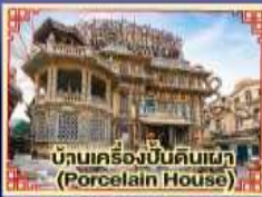
บ้านเครื่องปั้นดินเผา (Porcelain House)

มีพิเศษ.. เปิดปักกิ่ง, บึงย่างเทาหลี่, สุกี้ Haidilao