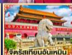
จักรุสเทียนอันเหมิน