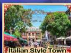
Italian Style Town