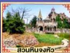
สวนหินงิ้วหวู่