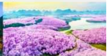
ชากรุงผิงป่า

*ทางบริษัทฯ ขอสงวนสิทธิ์ในการลิสโปรแกรมทัวร์ตามความเหมาะสมขึ้นอยู่กับสถานการณ์หน้างาน โดยคำนึงถึงผลประโยชน์ของลูกค้าเป็นสำคัญ