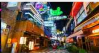
ถนนคนเดินซิงหยุน