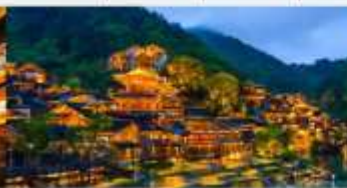
หมู่บ้านโบราณวูเจียงจ้าย