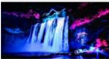
อุทยานน้ำตกหวงกั๋วซู่