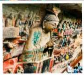
ผาหินแกะสลักต้าจู้