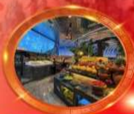
บุฟเฟต์หมีโพงลงซิ่ง