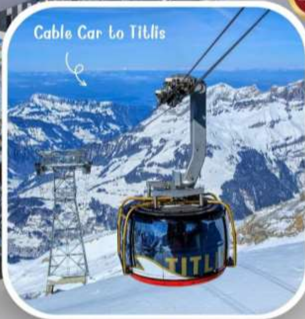
Cable Car to Titlis