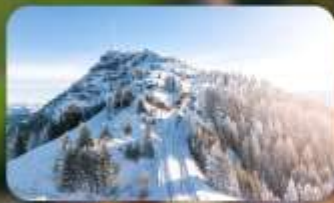
พิชิต 3 ยอดเขาดัง Rigi / Schilthorn / Gornergrat