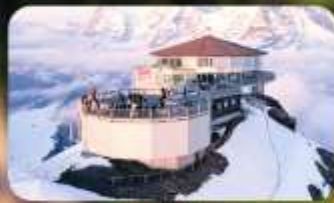
ทานอาหารที่ Piz Gloria ภัตตาคารที่หมุนได้ 360 องศา