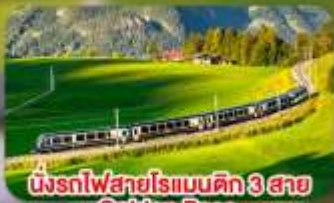
นั่งรถไฟสายโรเบินคิก 3 สาย Golden Pass / Luzern Interlaken Express / Gornergrat