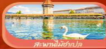
สะพานไมซ์ฮักปด

Highlight เมือหมู่บ้านแสนสวยเซอร์แมท เช็กอินศาลาไทยสุดงามที่โลซาน เที่ยวลูเซิร์น ชมสะพานไม้ชาเปลและอนุสาวรีย์สิงโต ซาลี แอปสทิน ชมประติมากรรม The Fork และปราสาทซิลลองริมทะเลสาบ เยือนมิลาน มหาวิหารดูโอโม เที่ยวเวนิส เมืองลอยน้ำสุดโรแมนติก อินกับรักอมตะที่บ้านจูเลียต และช้อปปิ้งจุใจที่ Serravalle Outlet