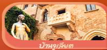
บ้านจูเลียต