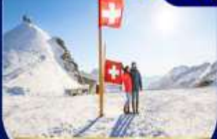
ยอดเขาวงพร้าว