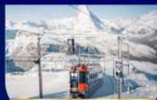
กอร์เนอร์กรัท