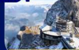
ยอดเขาพิลาตุส

นั่งรถไฟ Bernina Express เส้นทางรถไฟสายมรดกโลก