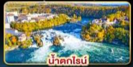
น้ำตกไรน์