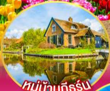
หมู่บ้านที่รูรัม